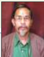
ফাটল টাট-ৰ ফল ফলত যাকৈচা ফল ফলত যাকৈচা ফল